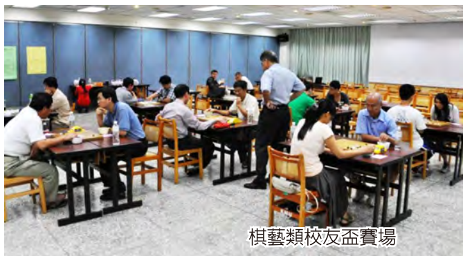
棋藝類校友盃賽場